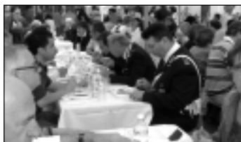
Foto sotto - Con o senza tavolo i nostri esperti assaggiatori si sono impegnati seriamente!

Anche i vigili mangiano... e come mangiano... Con impegno e serietà.