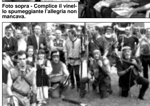
Gli arcieri di Chioggia con il sindaco di Rosolina (in piedi, il quarto da sx) che ha rifiutato di fare la parte del figlio di Guglielmo Tell, con la mela in testa, dopo aver osservato avversari politici confabulare con il capo degli arcieri.

famosa ditta di catering "Schiesari" di Villadose, hanno dovuto pazientare. Basta pensare che per smaltire la lunga fila e arrivare al tavolo dove simpatiche e gentili inservienti offrivano i piatti al radicchio: farfalle, risotto, radicchio al gratin con formaggio, arrosto, torta salata, c'è voluto più di un'ora. Il tutto da inaffiare con del prosecco niente male o dell'acqua "da far marsare il pali" o, al limite, con della volgare CocaCola che fa ruttare.