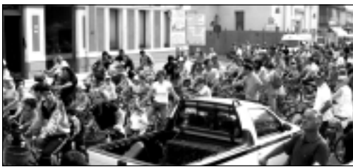
Sopra - La partenza della bicicletta. Più di 500 anime pronte a soffiare per 23 km.

Qualche lieve incidente; nulla di grave. Uno è caduto sui rovi, a un'altra: "Me sa robata la sela... Oih oih... aahh... aaahhh... aaaaahhhhh..." tranquilli, non era un la-